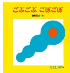
「ごぶごぶ ごぼごぼ」 作 駒形 克己 福音館書店

この3つの絵本はくり返しの言葉がたくさん登場します。ことばの音が楽しく、ひかり組でも読み始めると大喜びです。ことばがリズムよくでてくるので、私も読んでいて、楽しくなります。お子さんと一緒にお母さんも楽しんでください。