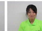
フォロー 笠井 光