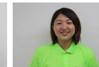
フォロー 徳元 利香