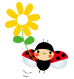
調理 荒谷 まり